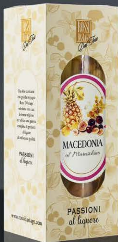
PASSIONI AL LIQUORE ASTUCCIO Astuccio in cartoncino.