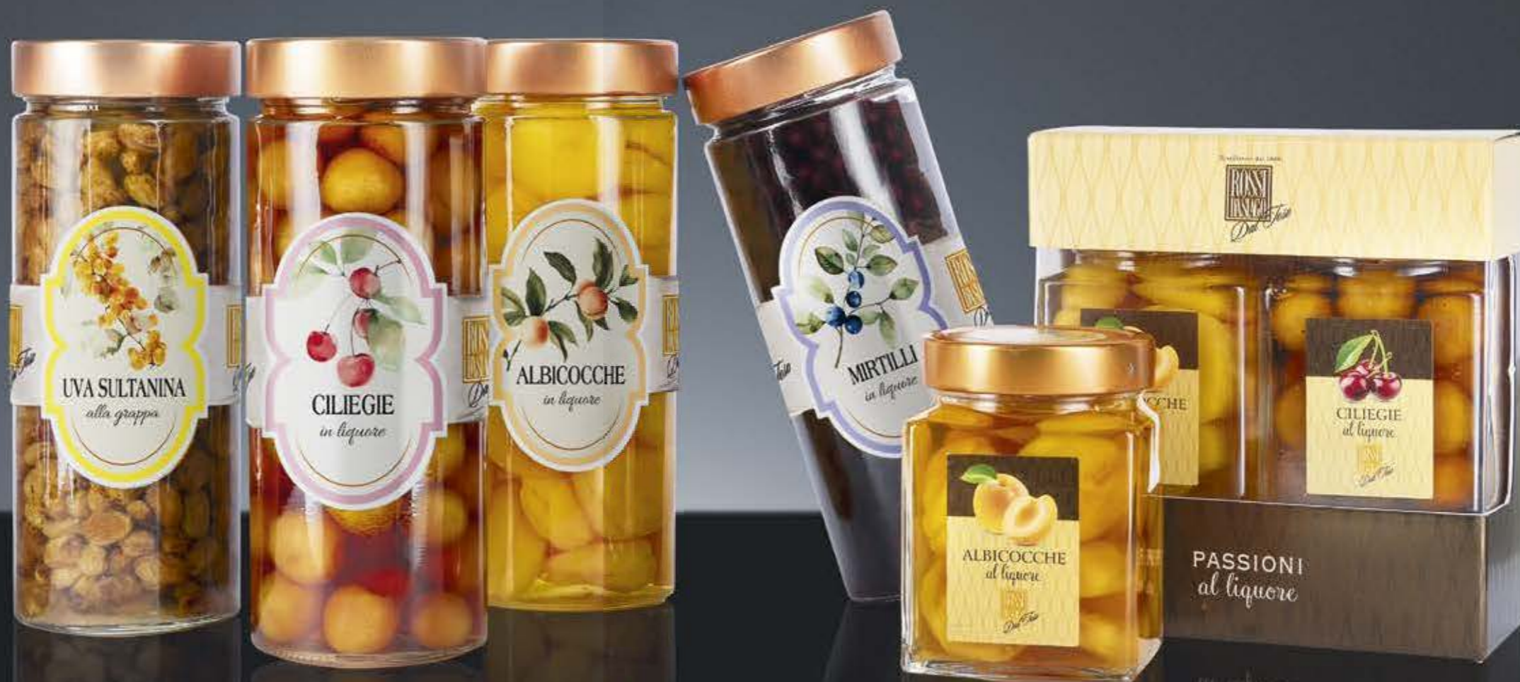
PASSIONI AL LIQUORE COFANETTO