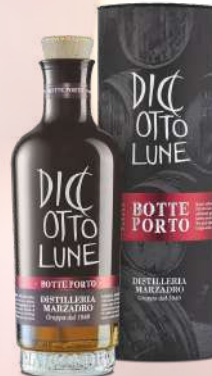
Diciotto Lune Riserva Porto